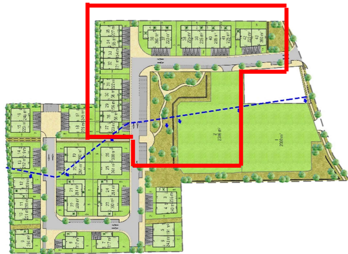
Grille de prix valable jusqu'au 30/04/2024